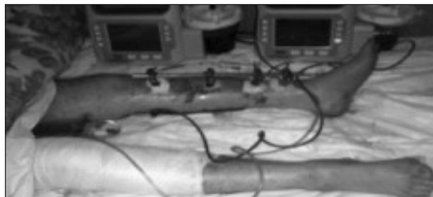
Рис. 2. Нижні кінцівки пацієнта К. після ПХО. Встановлений АЗФ та дві VAC-системи

Оцінено телеконсультацію за «Картою телемедичної консультації пацієнта з переломами довгих кісток на IV рівні медичної евакуації» і визначено високий рівень ефективності (11 балів). Одним з рішень телеконсультації було евакуювати пацієнта до НВМКЦ. Там проведено лабо-