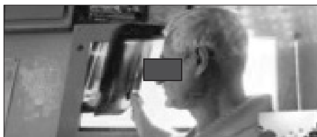
Рис. 3. Рентгенограми пацієнта К. на телеконсиліумі НВМКЦ та ВМКЦ Північного регіону