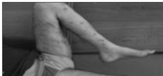
Рис. 4. Нижні кінцівки пацієнта К.: функціональна здатність лівої кінцівки

раторне та інструментальне обстеження хворого за відомим алгоритмом ведення пацієнтів з вогнепальними переломами довгих кісток, яке передбачало визначення рівня С-реактивного білка (менше ніж 5 мг/л), церулоплазміну (344 ммоль/л), ШОЕ (8 мм/г), рівня лейкоцитів ( 7,2 \times 10^9 /л), величини альбуміно-глобулінового коефіцієнту (1,6 од.). Клінічних ознак запалення та тромбозу вен нижніх кінцівок за результатами доплерографії не виявлено. Визначено доцільність заміни методу фіксації на блокувальний інтрамедулярний остеосинтез (БІОС).