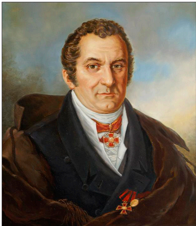
Фото 1. Профессор медицины Мухин Е. О.

Е. О. Мухин (фото 1) происходил из старинного дворянского рода, наделенного имением близ Чугуева Харьковской губернии еще во времена царя М. Ф. Романова. Ефрем Осипович родился в имении Зарожное (ныне село Зарожное Чугуевского района Харьковской области) 28 января (8 февраля по н. с.) 1766 года. Рано полюбив медицину, он поступил в Харьковский коллегиум, который до основания Харьковского университета считался одним из просветительских центров. Обучался там естественным наукам всего 8 мес., после чего среди лучших учеников коллегиума в 1788 г. был командирован согласно приказу князя Г. А. Потемкина в Елисаветградский (ныне Кировоградский) медицинский колледж имени Е. О. Мухина) генеральный госпиталь, при котором открывалась медико-хирургическая школа. Задачей школы было в самый короткий срок, в связи с войной против Турции, обучить студентов практическим навыкам перевязок, уходу за ранеными и проведению простейших операций, в чем Мухин проявил себя наилучшим образом. Спустя полгода он был причислен к главному госпиталю при главной квартире генерал-фельдмаршала князя Г. А. Потемкина. В 1788 г. участвовал в боях за остров Березань и во взятии турецкой крепости Очаков, был награжден медалью «За храбрость, оказанную при взятии Очакова». Он успешно проводил хирургические операции не только в лазарете, но и на поле битвы при содействии личного врача Г. А. Потем-