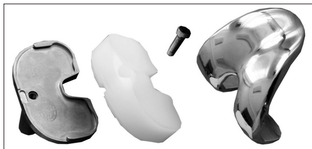
Рис. 1. Тотальный, эндопротез коленного сустава «Мотор Сич ЭПК-2»

За период с 2008 по 2014 г. в отделении травматологии и ортопедии ООО «Клиника Мотор Сич» выполнено 96 эндопротезирований коленного