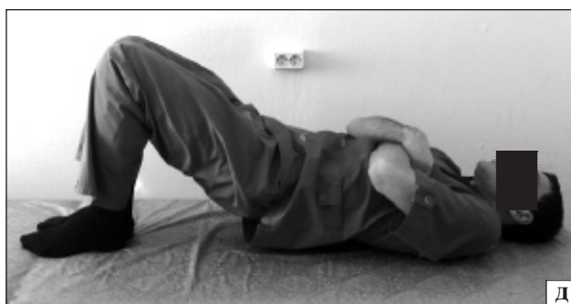
Рис. 2. Лечебные физические упражнения в режиме постизометрической релаксации (а–в — для мышц грудного и поясничного отделов позвоночника, ягодичных мышц) и в режиме изометрической стабилизации (г, д — для мышц поясницы, брюшной стенки и ягодиц)