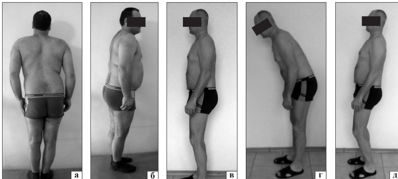
Рис. 1. Миотонические реакции у больных поясничных остеохондрозом с анталгическими установками туловища: а, б) анталгический сколиоз с лордозированием грудных и поясничных сегментов (экстензионный паттерн); в) анталгический сколиоз с кифозированием поясничных сегментов (флексионный паттерн); г, д) миофиксация поясничного отдела позвоночника при сагиттальных движениях туловища

области и нижних конечностей и, в ряде случаев, формирования компенсаторных установок в тазобедренном суставе.