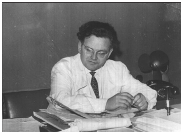
Рис. 2. Директор Українського НДІ ортопедії та травматології ім. проф. М. І. Ситенка (1965 рік)

Інститут за розпорядженням МОЗ України стає головною організацією в республіці з цієї проблеми (рис. 3).