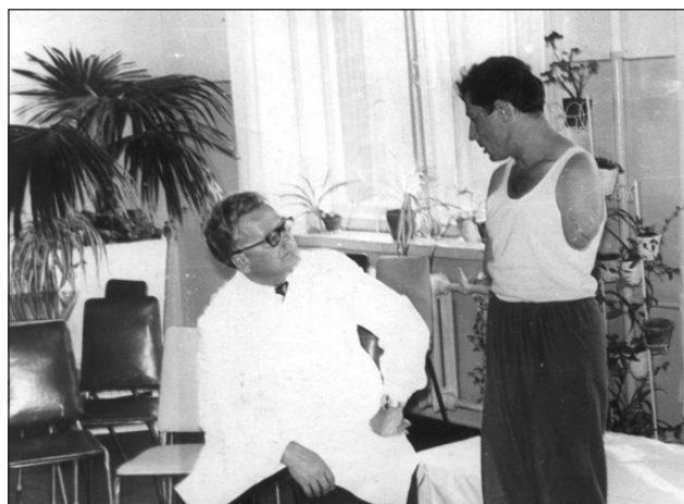
Рис. 3. Академік консультує хворого з ампутацією лівої верхньої кінцівки

У цьому ж 1965 році О. О. Корж створює в Українському НДІ ортопедії та травматології ім. проф. М. І. Ситенка першу в Україні науково-дослідну лабораторію нових матеріалів для розробки ортопедичних засобів для лікування та реабілітації хворих (рис. 4). У подальшому ці наукові дослідження направили на створення керамічних і сапфірових імплантатів для хірургічного лікування пацієнтів із патологією хребта та суглобів, різних ортезів і методик їхнього застосування в реабілітаційному процесі.