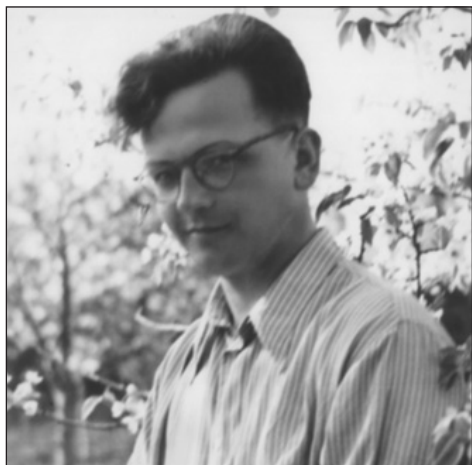
Рис. 1. Початок роботи в Українському НДІ ортопедії та травматології ім. проф. М. І. Ситенка (1951 рік)

У 50–60-ті повоєнні роки ХХ ст. актуальною була проблема лікування постраждалих із наслідками бойової травми та з ампутаціями кінцівок. Корж уперше в Україні започаткував і очолив досить важливі на той час наукові дослідження щодо покращення організації протезно-ортопедичної допомоги інвалідам.