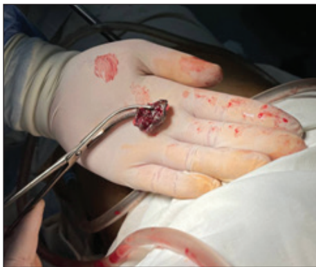
Рис. 3. Видалене стороннє тіло (металевий осколок)

Операції: торакоцентез, дренажування правої плевральної порожнини за Бюлау; ПХО вогнепальної рани.