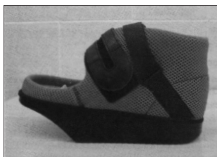
Рис. 2. Взуття Барука