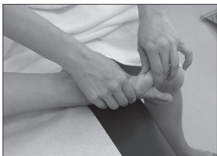
Рис. 4. Самостійна мобілізація I плесно-фалангового суглоба за L. S. Barouk [11]

Курс міофасціального масажу розпочинали через 4 тижні після операції та проводили щод-