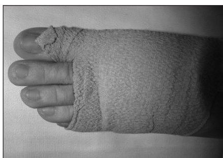
Рис. 1. Еластична пов'язка на передній та середній відділі стопи в післяопераційному періоді

На відміну від контрольної групи, в основній додатково використовували методики мануальної терапії та міофасціального масажу. Останній передбачав виконання масажних рухів до появи болю: глибоке прогладжування, розтирання, розминання. Його основною метою був вплив на міофасціальні тригерні точки, які формуються в м'язах і зв'язках стабілізаторів стопи [8], призводять до порушення їхньої функції та виникнення болю [9].