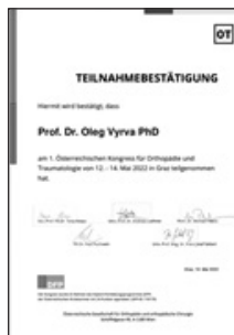
Рис. 4. СМЕ-сертифікат учасника конгресу