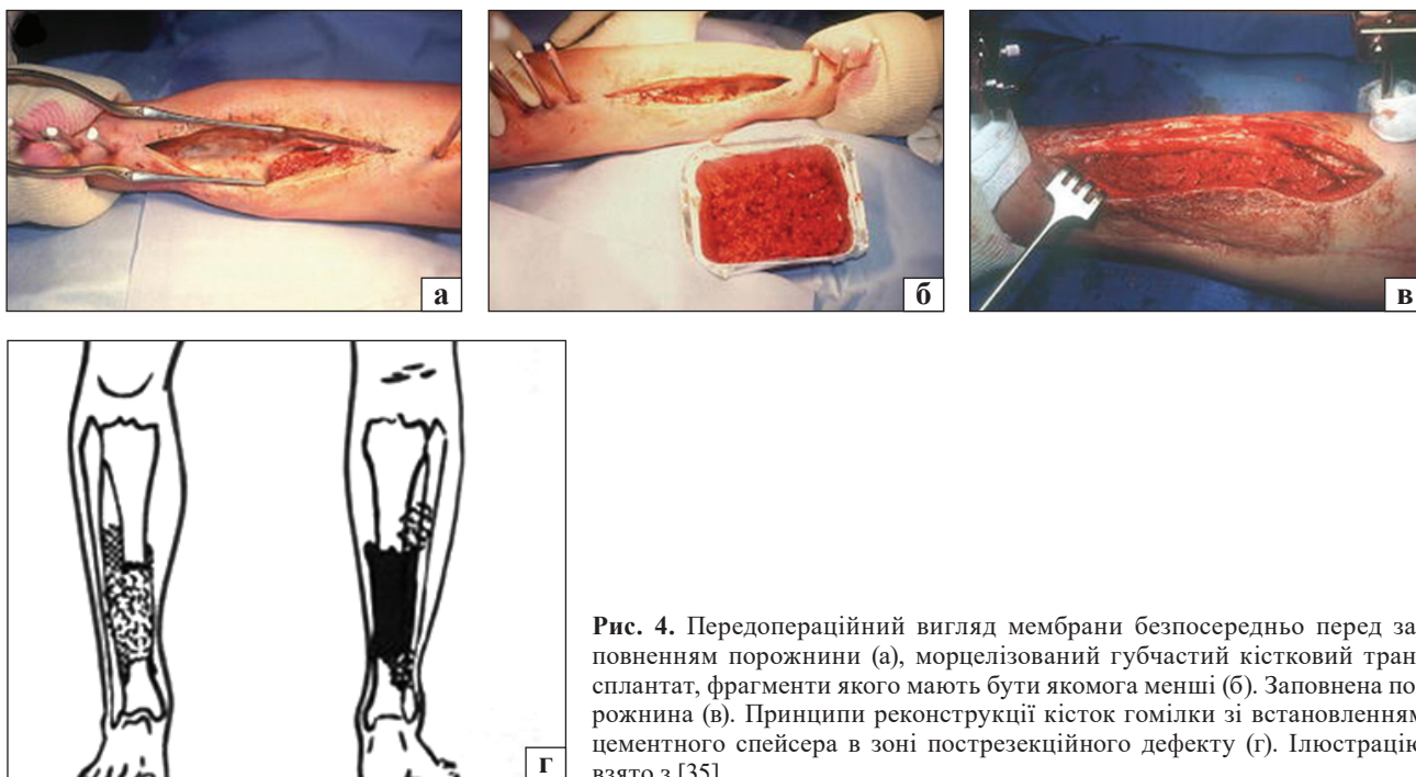
Рис. 4. Передопераційний вигляд мембрани безпосередньо перед заповненням порожнини (а), морцелізований губчастий кістковий трансплантат, фрагменти якого мають бути якомога менші (б). Заповнена порожнина (в). Принципи реконструкції кісток гомілки зі встановленням цементного спейсера в зоні пострезекційного дефекту (г). Ілюстрацію взято з [35]

Ставлення до ампутації як методу хірургічного лікування УПКГ у дітей, значно відрізняється в різних частинах світу та навіть медичних центрах у межах однієї країни. Деякі фахівці розглядають її як паліативну методику, що виконують у випадках неефективності реконструктивних втручань. Інші — як один із дієвих способів первинного хірургічного лікування, що дозволяє уникнути багаторазових оперативних втручань [36]. Кілька досліджень продемонстрували гарні функціональні результати, швидку адаптацію та високу якість життя дітей після ампутацій із приводу різної патології (травми, онкологічні захворювання тощо).