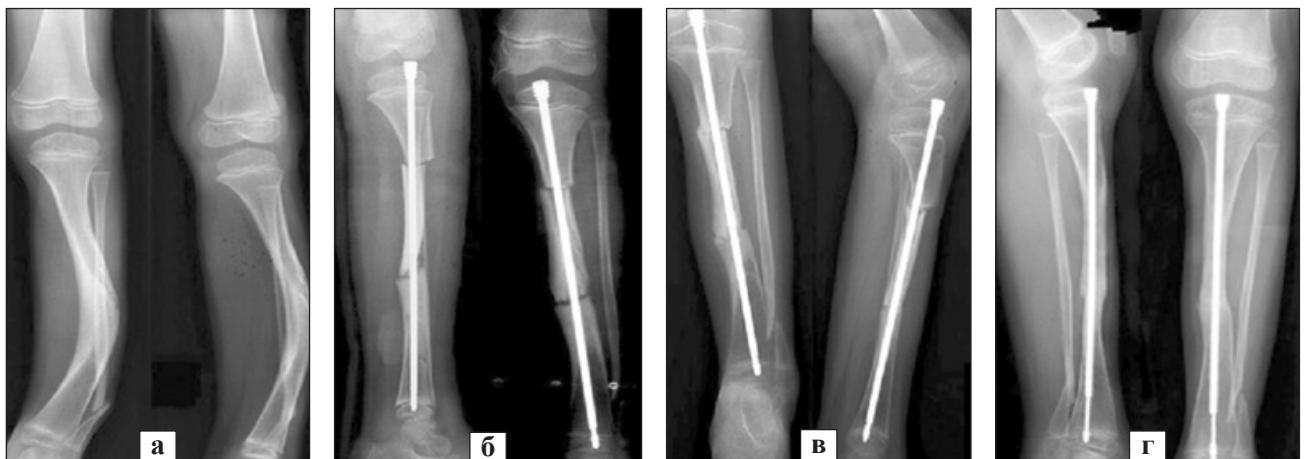
Рис. 3. Приклад використання інтрамедулярного фіксатора Fassieur-Duval. Рентгенографія УПКГ до (а) на етапах (б, в) та після хірургічного лікування (г). Ілюстрацію взято з [29]

Поєднане використання АЗФ та інтрамедулярних пристроїв із кістковою автопластиком дозволяє застосувати біомеханічні переваги обох фіксаторів. АЗФ сприяє досягненню корекції положення кісткових фрагментів гомілки, забезпечуючи при цьому необхідні для консолідації умови стабільності, а інтрамедулярний фіксатор попереджує рефрактуру в зоні УПКГ [30]. Результати хірургічного лікування УПКГ за допомогою резекції, кісткової автопластики та комбінованого використання інтрамедулярних і зовнішніх пристроїв (АЗФ) дають змогу отримати консолідацію від 40 до 100 % випадків. При цьому частота рефрактури не перебільшує 40 %. Відсутня єдина думка щодо часу виконання профілактичної інтрамедулярної фіксації стрижнями кісток гомілки [31]. Зокрема, деякі фахівці виконують інтрамедулярну фіксацію