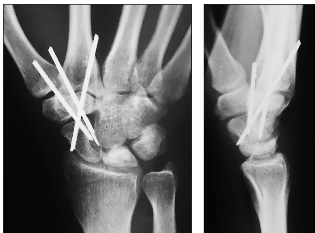
Рис. 2. Рентгенограма після втручання: човноподібна кістка розігнута, півмісяцева — розвантажена

структури півмісяцевої кістки, а саме: консолідацію її патологічного перелому, часткове ремоделювання (рис. 3), стабілізацію показників індексу кистьового суглоба та променево-човноподібного кута.