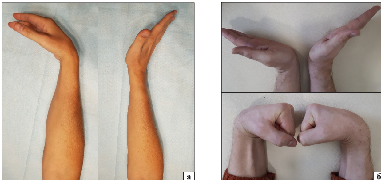
Рис. 4. Фото згинально-розгинальної амплітуди хворого Г., 38 років, із хворобою Кінбека IIIб стадії правої кисті: а) перед втручанням; б) через 13 міс. після введення ВМАС і тимчасової STT-фіксації

Середні показники променево-човноподібного кута зменшились на 4,7^\circ \pm 4,9^\circ , що свідчить про прогресування нестабільності та колапсу зап'ястка, як і середнє зменшення індексу висоти кистьового суглоба на показник 0,01 \pm 0,01 .