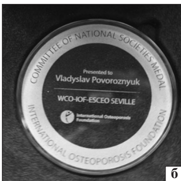
Рис. 8. Вручення медалі комітету Міжнародної асоціації остеопорозу «За активну участь у діяльності Комітету національних товариств та поширення місії IOF» (2014). Генеральний директор Міжнародної асоціації остеопорозу Judy Stenmark (зліва); проф. Поворознюк В. В.; президент Європейського товариства з клінічних та економічних аспектів остеопорозу та остеоартриту проф. J-Y. Reginster (а); медаль (б)