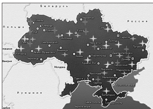
Рис. 4. Регіони України, в яких проведено епідеміологічні дослідження (1995–2014)

За ініціативи професора у 1996 році створено Українську асоціацію остеопорозу, президентом якої він став, та Український науково-медичний центр проблем остеопорозу, який надає консультативно-діагностичну допомогу пацієнтам із різних регіонів України. Владислав Володимирович входить до Правління IOF та бере активну участь у роботі цієї організації. Був ініціатором проведення I Міжнародної конференції «Актуальні