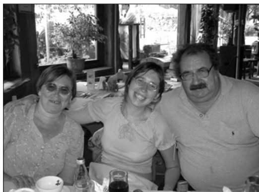
Рис. 2. В. В. Поворознюк із дружиною та донькою

Наукові дослідження професора Поворознюка В. В. охоплюють широке коло теоретичної та клінічної медицини: вивчення особливостей дегенеративно-дистрофічних змін хребта та суглобів у людей різного віку, визначення основних показників структурно-функціонального стану кісткової тканини й клінічних проявів старіння кісткової системи, нервово-м'язового апарату передньої грудної стінки, які відповідають за виникнення синдрому вертеброгенної кардіалгії в людей різного віку. Професором запропоновані диференційно-діагностичні критерії верифікації вертеброгенних кардіалгій і больового синдрому в ділянці серця, зумовленого ішемічною хворобою (ІХС); визначені особливості терапевтичних заходів за умов вертеброгенних кардіалгій та ІХС у поєднанні з дистрофічно-деструктивними змінами шийно-грудного відділу хребта; розроблений і запропонований лікувальний комплекс для терапії вертеброгенних кардіалгій і вертеброкардіального синдрому в людей різного віку. Для оцінювання стану здоров'я працівників промислових підприємств уперше в Україні ним застосовано автоматизовану систему кількісного аналізу ризику виникнення основних патологічних синдромів (АСКОРС). Використання диференційованих програм реабілітації працівників підприємств із вертеброгенною патологією сприяло зниженню захворюваності хребта і профілактиці передчасного старіння.