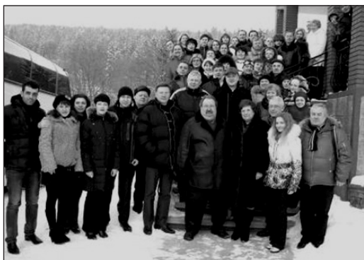
Рис. 5. Учасники Міжнародної школи «Кістково-м'язова система та вік», Яремче