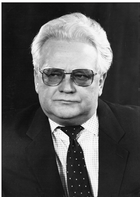
Рис. 6. Директор інституту з 1965 по 1996 рр. академік АМН СРСР професор О. О. Корж

Ураховуючи значний досвід спеціалістів Інституту ім. проф. М. І. Ситенка в галузі профілактики виробничого, вуличного та дорожньо-транспортного травматизму, рішенням Ради Міністрів УРСР і МОЗ України на його базі створено Республіканський науково-організаційний центр із профілактики автодорожнього та побутового травматизму. У період 1980–1985 рр. інститут був головним координаційним центром Республіканської державної міжвідомчої програми боротьби з дорожньо-транспортним травматизмом, для забезпечення роботи якого на базі організаційно-методичного відділу спеціально створено автодорожню групу. За результатами проведеної комплексної роботи видано інструкцію з надання першої медичної допомоги в разі автодорожніх травм, методичні рекомендації [9, 10], Положення про порядок та етапність надання допомоги постраждалим у ДТП на догоспітальному етапі, затверджене спільним наказом МВС та МОЗ України № 580/343 від 20.09.1985 [11].