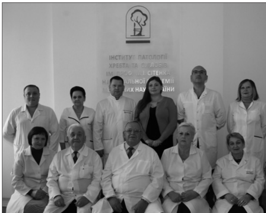
Рис. 9. Колектив науково-організаційного відділу з директором інституту професором Коржем М. О., 2019 р.

Організація та методичний супровід підготовки наукових і науково-педагогічних кадрів із травматології і ортопедії, підвищення кваліфікації лікарів і середнього медичного персоналу, які забезпечують надання медичної допомоги травмованим і хворим із патологією опорно-рухової системи, стали одним із найважливіших напрямів організаційно-методичної роботи. Наприкінці 20-х років ХХ ст. розпочато навчання в інституті лікарів-інтернів методам діагностики та лікування хворих зі вказаною патологією, підготовку наукових кадрів з ортопедії та травматології в аспірантурі, а також проведення курсів для середнього медичного персоналу з гіпсової техніки, короткострокових курсів і семінарів для лікарів із актуальних питань ортопедії та травматології. Із 1931 р. організовано циклічні (тематичні) курси з підвищення кваліфікації лікарів ортопедів-травматологів, які у 1982 р. замінено на постійно діючі курси інформації та стажування. Із кінця 30-х років ХХ ст. введено вищу форму підвищення кваліфікації лікарів — клінічну ординатуру за спеціальністю «ортопедія і травматологія» [2, 3].