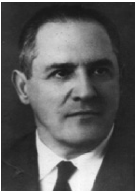
Рис. 5. Директор інституту з 1943 по 1965 рр. член-кореспондент АМН СРСР професор М. П. Новаченко

Наприкінці 50-х років ХХ сторіччя у підшефних інституту областях Лівобережної України створено 40 НОПів, які активно розвивали мережу спеціалізованих ортопедо-травматологічних закладів.