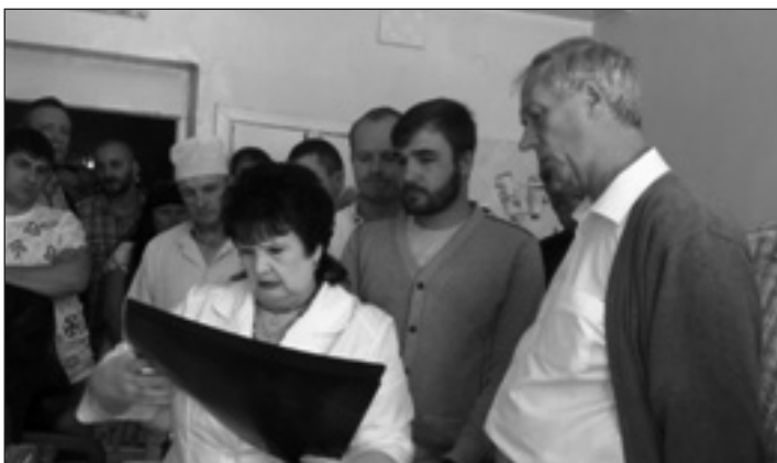
Рис. 8. Дні ортопеда-травматолога