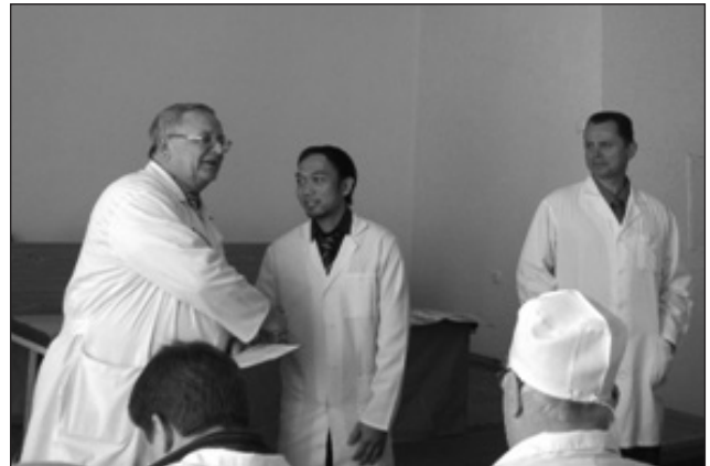
Рис. 7. Вручення сертифікату про закінчення клінічної ординатури лікарю з Індонезії (2017)

Вирішення проблем профілактики, зниження показників смертності й інвалідності внаслідок травм, а також періоду непрацездатності й інвалідності через захворювання кістково-м'язової системи можливе за умов упровадження ефективних технологій і сучасних методів лікування. Вагомим чинником при цьому є індивідуальна майстерність лікаря.