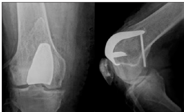
Рис. 2. Рентгенограмма правого коленного сустава пациентки Р. после операции

Пациентке выполнена рентгенография и КТ (рис. 3). Размеры субхондральной кисты мало изменились за 10 лет: максимальная динамика ее увеличения составила 5 мм.