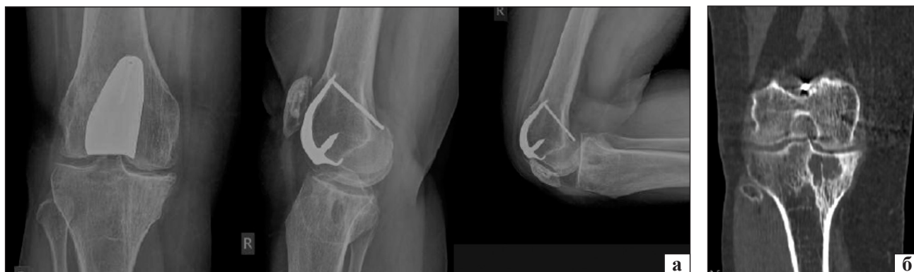
Рис. 3. Коленный сустав пациентки Р. через 10 лет после операции: а) рентгенограмма; б) КТ, МРТ, субхондральная киста внутреннего мыщелка большеберцовой кости

В настоящее время продолжается поиск способов лечения артроза крупных суставов с целью продления активного их функционирования и максимальной отсрочки тотального эндопротезирования [6]. Это связано с такими серьезными осложнениями, как глубокая инфекция, асептическая нестабильность и расшатывание имплантатов, нередкая необходимость реэндопротезирования [28, 29]. Одно из современных быстро развивающихся направлений в ортопедии — ограниченная артропластика при артрозах, типичным примером которой является одномышечковое эндопротезирование.