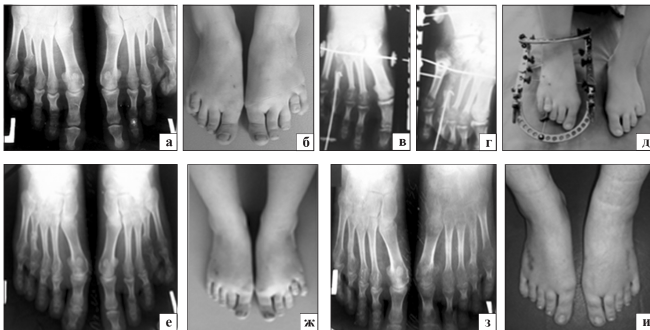
Рис. 2. Фото и рентгенограмма стоп в прямой проекции больной А. до лечения (а, б), в процессе (в, г) и конце (справа) дистракции (д), после снятия аппарата (е, ж) и через 1 год после операции (з, и)

ние плюсневых костей составляло по 2 см с обеих сторон. Дистракционный период продолжался 23 дня, фиксационный — 62. Достигнуто восстановление «плюсневой параболы». Контрольный осмотр через год показал, что результат удлинения сохранился, косметический дефект устранен. Нагрузка на конечность полная и безболезненная, пациентки пользуются обычной и открытой обувью (рис. 2).