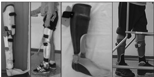
Рис. 9. Ортопедичне забезпечення для осіб із III рівнем втрати рухових функцій