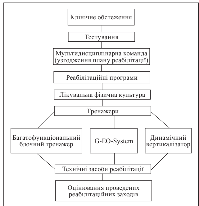
Рис. 7. Алгоритм надання реабілітаційних послуг пацієнтам із III рівнем втрати рухових функцій

Пацієнти з третім рівнем втрати рухових функцій могли утримувати рівновагу в положенні сидячи без обмеження часу, мали достатню функцію верхніх кінцівок, спроможність до пересування за умов фіксації колінних і надп'ятково-гомількових суглобів. Для них було внесено зміни в алгоритм надання реабілітаційних послуг (рис. 7), тобто виключено динамічний параподіум і введено багатофункціональний блочний тренажер (рис. 8), який забезпечує вплив на певну групу м'язів. Блочна система з протитягами дає змогу дозовано змінювати навантаження, а індивідуально розроблені вправи забезпечують тренування майже всіх м'язових груп. Мета забезпечення технічними засобами цієї категорії хворих — створення умов для ходьби. Їх реалізували шляхом призначення ортезів на «колінний – надп'ятково-гомільковий суглоб – стопу», або на «надп'ятково-гомільковий суглоб – стопу» з елементом замикання в колінному суглобі у фазі навантаження (рис. 9).