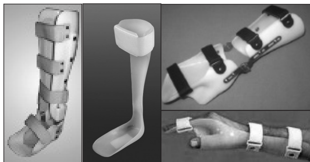
Рис. 3. Ортезні системи на нижні та верхні кінцівки для першого рівня втрати рухових функцій

формування навичок підтримки рівноваги в положенні сидячи; навчання елементам самообслуговування та користування кріслом колісним. Для зменшення ортостатичних реакцій, попередження остеопроза та контрактур нижніх кінцівок, стимуляції кровообігу застосовували динамічний вертикалізатор (рис. 2, а) та динамічний пароподіум (рис. 2, б). Останній дає змогу одночасно тренувати функцію опори та балансування, розширюючи навички самообслуговування. Тренування верхніх кінцівок для активних і пасивних рухів проводили за допомогою автоматизованого програмного комплексу Hand of Hope (рис. 2, в) [4]. Ортезне забезпечення для цієї групи хворих передбачає профілактику контрактур і патологічної постави в суглобах верхніх і нижніх кінцівок (рис. 3). Після проведеного курсу реабілітації із 239 осіб першої групи у 222 (92,9 %)