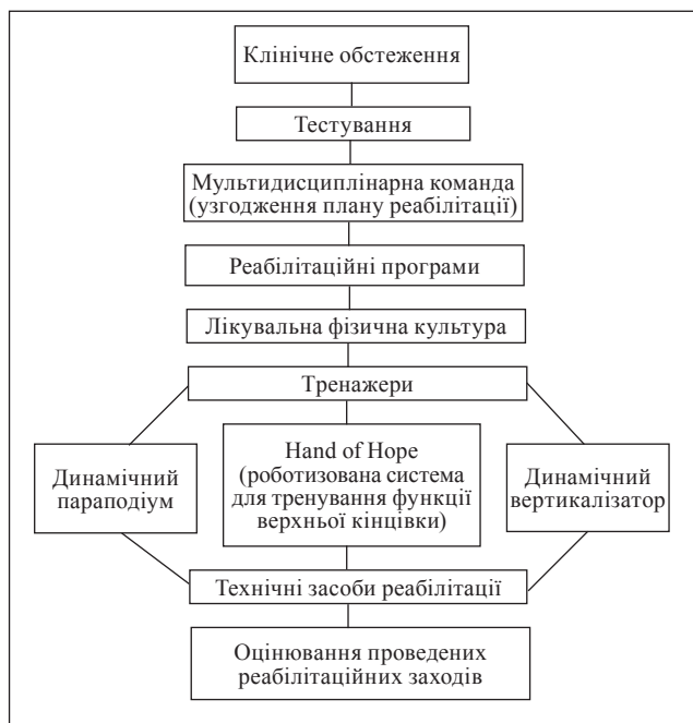
Рис. 1. Алгоритм надання реабілітаційних послуг пацієнтам із I рівнем втрати рухових функцій

(рис. 1), згідно з яким на підставі клінічного обстеження і тестування, за рішенням мультидисциплінарної команди затверджували реабілітаційну програму. Вона передбачала: призначення лікування фізичної культури з метою підготовки функціональних систем організму до тренувальних навантажень; відновлення сили збережених активних рухів м'язів верхніх кінцівок і тулуба;