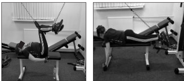
Рис. 8. Багатофункціональний блочний тренажер