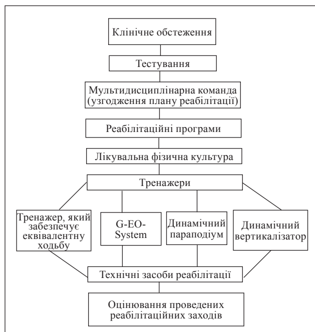
Рис. 4. Алгоритм надання реабілітаційних послуг пацієнтам із II рівнем втрати рухових функцій