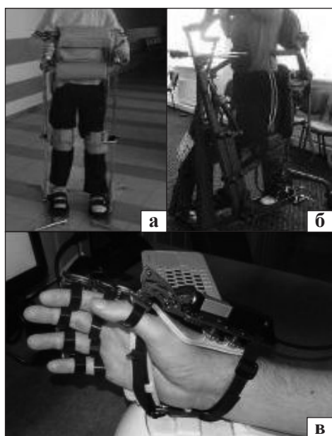
Рис. 2. Засоби технічної реабілітації для першого рівня втрати рухових функцій: пароподіум (а), вертикалізатор (б), комплекс Hand of Hope (в)

формування навичок підтримки рівноваги в положенні сидячи; навчання елементам самообслуговування та користування кріслом колісним. Для зменшення ортостатичних реакцій, попередження остеопроза та контрактур нижніх кінцівок, стимуляції кровообігу застосовували динамічний вертикалізатор (рис. 2, а) та динамічний пароподіум (рис. 2, б). Останній дає змогу одночасно тренувати функцію опори та балансування, розширюючи навички самообслуговування. Тренування верхніх кінцівок для активних і пасивних рухів проводили за допомогою автоматизованого програмного комплексу Hand of Hope (рис. 2, в) [4]. Ортезне забезпечення для цієї групи хворих передбачає профілактику контрактур і патологічної постави в суглобах верхніх і нижніх кінцівок (рис. 3). Після проведеного курсу реабілітації із 239 осіб першої групи у 222 (92,9 %)