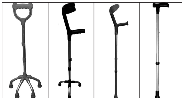
Рис. 11. Допоміжні засоби для особистої рухомості, керовані однією рукою

Після проведеного курсу реабілітації з 16 пацієнтів цієї групи, 10 (62,5 %) опанували пересування в ортезних системах зі застосуванням додаткової опори в межах приміщення або з мінімальною сторонньою допомогою поза ним; 6 (37,5 %) — самостійне пересування в ортезних системах із додатковою опорою (ходунки) як у межах приміщення, так і поза ним.