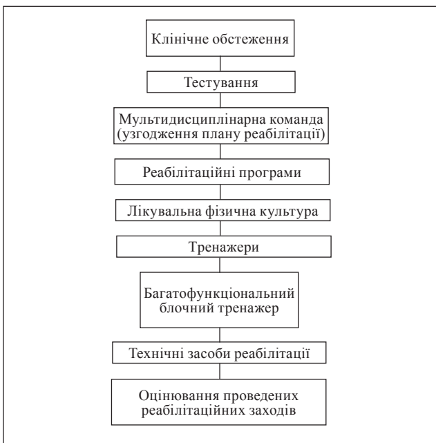
Рис. 10. Алгоритм надання реабілітаційних послуг пацієнтам із IV рівнем втрати рухових функцій

Після проведеного курсу реабілітації з 16 пацієнтів цієї групи, 10 (62,5 %) опанували пересування в ортезних системах зі застосуванням додаткової опори в межах приміщення або з мінімальною сторонньою допомогою поза ним; 6 (37,5 %) — самостійне пересування в ортезних системах із додатковою опорою (ходунки) як у межах приміщення, так і поза ним.