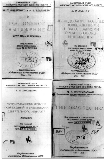
Фото 2. Серія монографій «В допомогу воєнному хірургу», яка видана перед Великою Вітчизняною війною згідно з рішенням ІІ Українського з'їзду ортопедів-травматологів