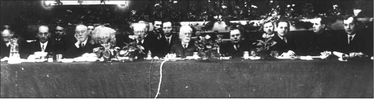
Фото 1. Президія I Українського з'їзду ортопедів-травматологів та працівників протезної справи (у першому ряду зліва направо): проф. Фрумін І.О. (Київ), проф. Трегубов С.Л. (Харків), проф. Кефер М.І. (Одеса), проф. Краснобаєв Т.П. (Москва), проф. Ситенко М.І. (Харків), проф. Чаклін В.Д. (Сведловськ), доц. Новаченко М.П. (Харків), крайній справа доц. Котов А.П. (Харків)

обговорення доповідей ортопедів, і вже у 1926 р. на I Українському з'їзді хірургів, який відбувся в Одесі, було прийнято рішення про виокремлення ортопедо-травматологічного дня на кожному наступному з'їзді. Здійснення вказаних заходів сприяло швидкому розвитку ортопедії і травматології в Україні. У вересні 1930 р. на Республіканській нараді ортопедів-травматологів, де взяли участь понад 100 фахівців з Харкова, Києва, Одеси, Москви, Ленінграда та інших міст, вперше було поставлено питання про організацію Всесоюзного товариства і скликання I з'їзду ортопедів-травматологів України [3, 4, 7].