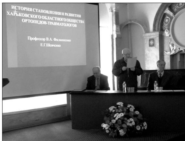
Рис. 1. Відкриття конференції, присвяченої 90-річчю ХООВГО «УАОТ»

Протягом усієї історії Харківського обласного товариства ортопедів-травматологів його очолювали провідні вчені Харкова (рис. 2).