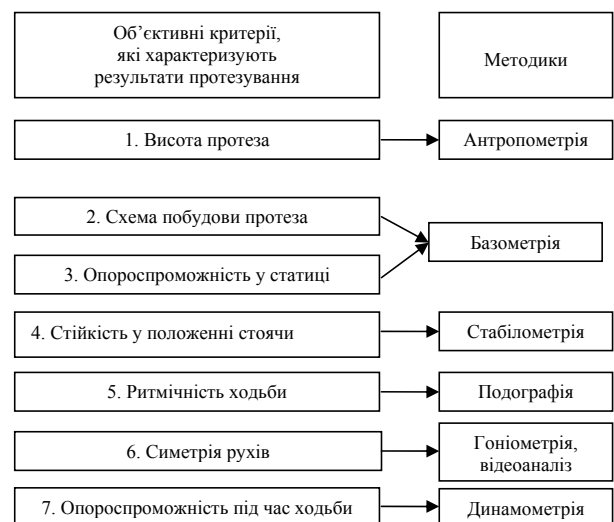
Рис. 1. Критерії, які характеризують результати протезування та методики для їх визначення

Гоніометрія, відеоаналіз — це методики, які використовують для визначення ритмічності та симетрії рухів людини під час ходьби, а також для контролю динамічної корекції схеми побудови протеза.