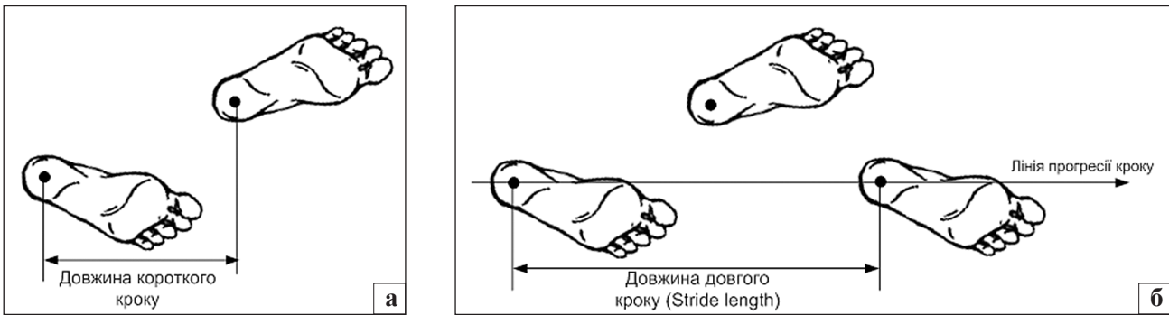
Рис. 1. Схема вимірювання довжини короткого (а) та довгого (б) кроків

призначали лікувальну фізкультуру, механотерапію, масаж, гідрокінезотерапію.