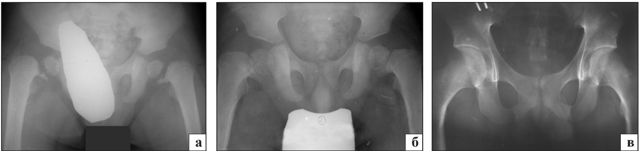
Рис. 2. Рентгенограма кульшового суглоба хворого М., 2 роки: а) первинна, б) через 3 міс. після початку консервативного лікування, в) через 17 років

Випадки прогресування варусної деформації шийки стегнової кістки, формування псевдоартрозу на місці осередка патологічної перебудови, виражених дистрофічних змін у проксимальному відділі стегнової кістки однозначно потребують своєчасного та адекватного хірургічного лікування, яке дозволяє отримати хороші та відмінні відділені анатомічні та функціональні результати.